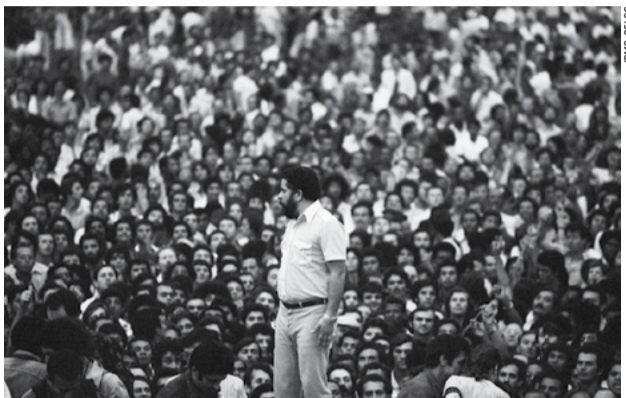
1979 – Lula organiza os trabalhadores para lutar por democracia e por melhores salários e condições de trabalho. O Estádio da Vila Euclides, em São Bernardo, é o palco do movimento dos metalúrgicos do ABC