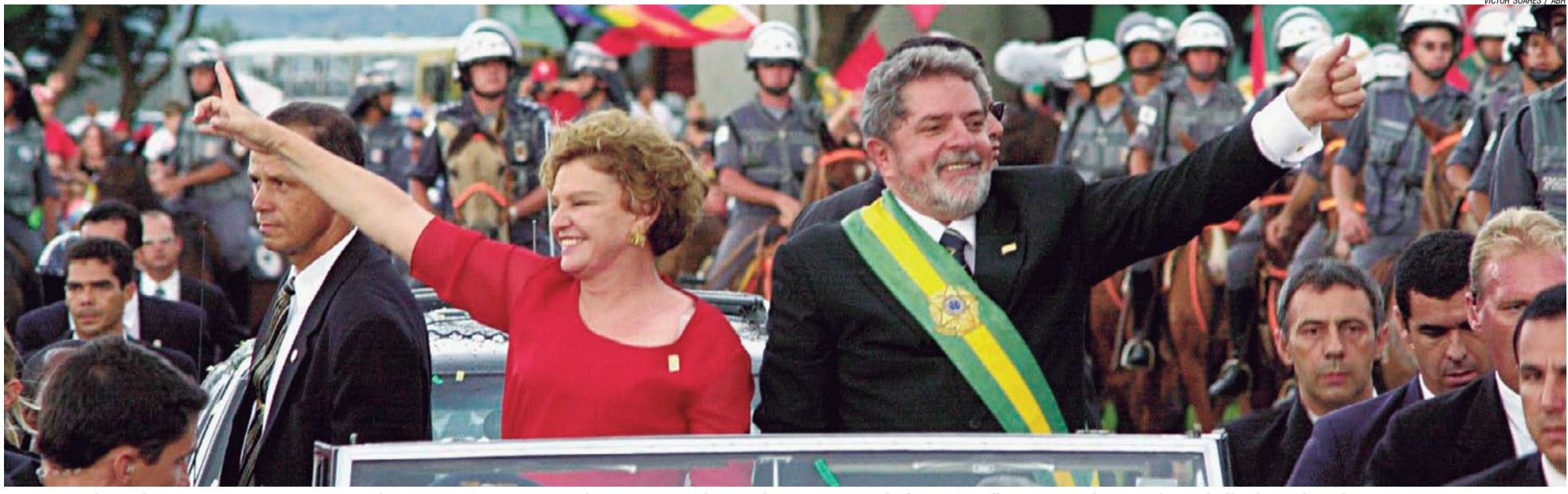
2003 – No dia 1º de janeiro toma posse em Brasília, como o primeiro presidente operário do Brasil, em uma grande festa vermelha com a militância dos trabalhadores de todo o País, que se organizaram em caravanas para participar deste momento histórico