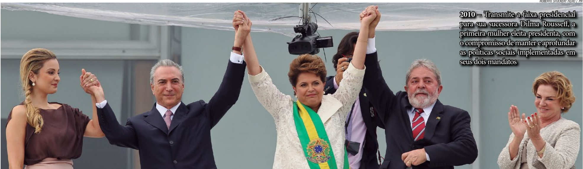
2010 – Transmite a faixa presidencial para sua sucessora Dilma Rousseff, a primeira mulher eleita presidenta, com o compromisso de manter e aprofundar as políticas sociais implementadas em seus dois mandatos