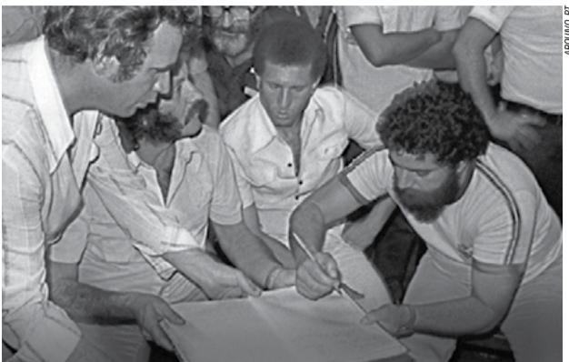
1981 – Sem voz e representação em um parlamento dividido entre apenas dois partidos - a Aliança Renovadora Nacional, Arena, que dava sustentação ao regime ditatorial, e o Movimento Democrático Brasileiro, o MDB – junto a outros companheiros constrói o Partido dos Trabalhadores, o PT