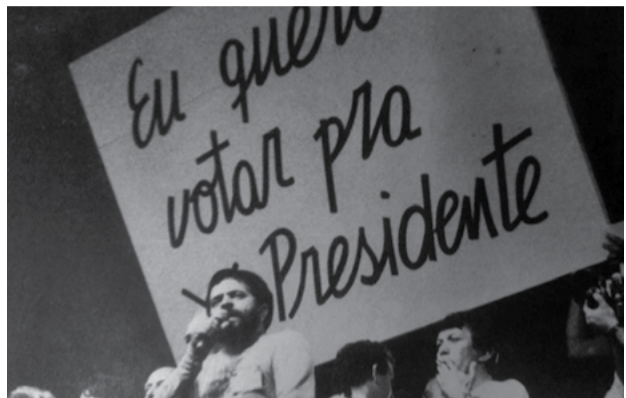
1983/1984 – É uma das principais lideranças políticas na campanha pelas eleições Diretas Já, que mobilizou uma massa social de um milhão e meio de pessoas na Praça da Sé, em 16 de abril de 1984. O colégio eleitoral rejeitou as Diretas e adiou o sonho dos brasileiros de eleger o presidente