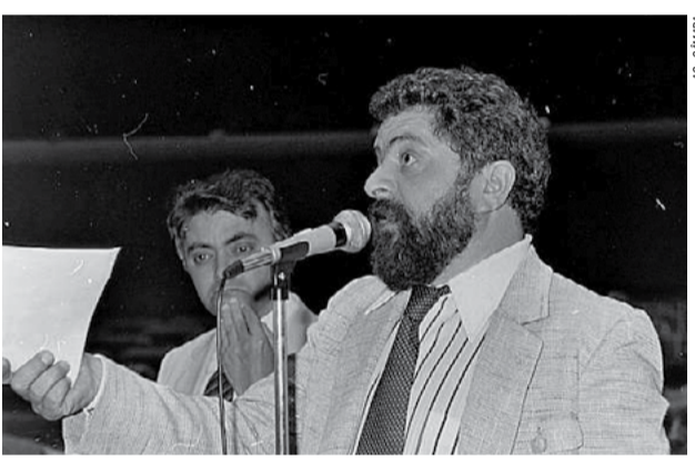
1986 – É eleito deputado federal constituinte, pelo PT, com a maior votação do País, e participa ativamente da elaboração da Constituição Federal, promulgada em 1988, a Constituição Cidadã, como o documento que rege as principais leis do Brasil ficou conhecida